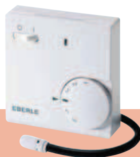
FR-E 525 31