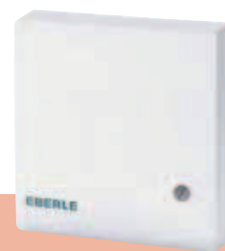
F 190 021